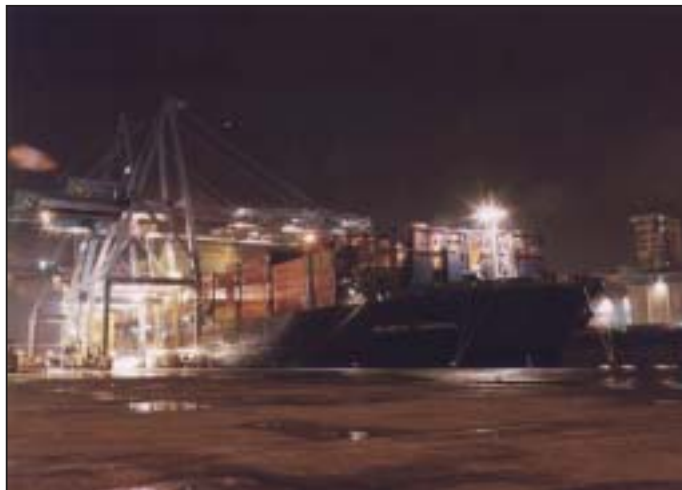
ACL roro/container vessel "Atlantic Compass"

Contact: Vincent Vermeulen - vvermeulen@aclcargo.com