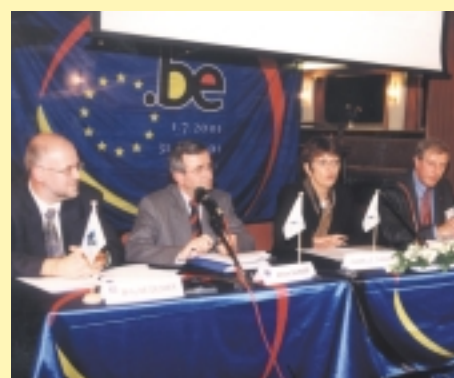
Workshop 2011, 140 deelnemers. Slottoespraak door Minister Isabelle Durant.

Zowel in het Verenigd Koninkrijk als in Duitsland gaan stemmen op om de vrachtwagens die gebruik maken van de wegen in deze landen, daarvoor te laten betalen. Een item om op te volgen! Het zal uiteraard de transportcondities beïnvloeden en kan verscheperen ertoe aanzetten hun logistieke keten opnieuw te bekijken. Het transport via de zee kan dan een uitstekend alternatief bieden.