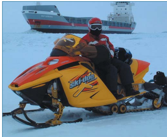
Shortsea Shipping in de ijsvlakte rond Finland

De sss-traffic in Gent steeg met 508 274 ton t.o.v. 2001. De terugval in 2001 werd ruimschoots goedge maakt, men zit zelfs boven het peil van 1999 en 2000.