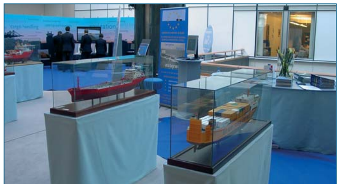
Deelname van Europees Shortsea Network aan een tentoonstelling in het Europees Parlement (Brussel, februari 2003)

Beide voorbeelden maken duidelijk dat niet alleen afstand maar ook snelheid relatieve begrippen zijn in shortsea. De regelmaat en de betrouwbaarheid van de opgezette diensten zijn de beste troeven om de verschepers te overtuigen.