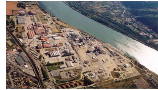
Les Roches, Frankrijk