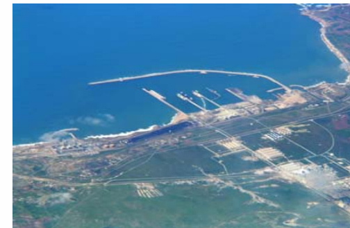
Jorf Lasfar, Marokko